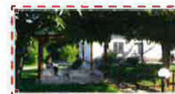
Un jardin sécurisé